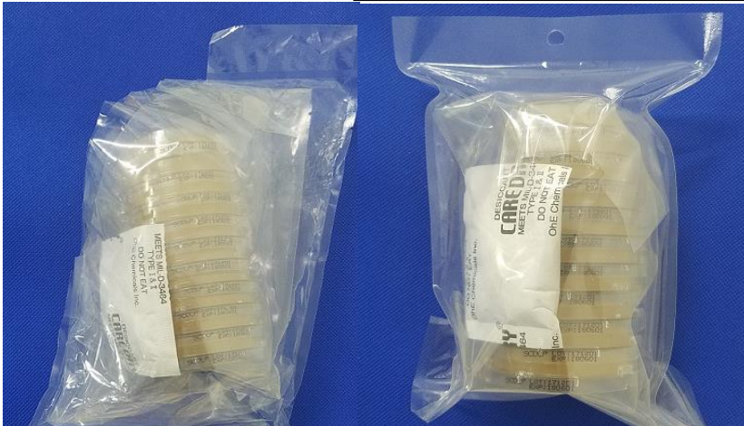
3重包装仕様に対応いたします